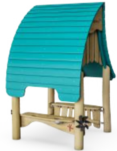
2 Houten speelhuisje